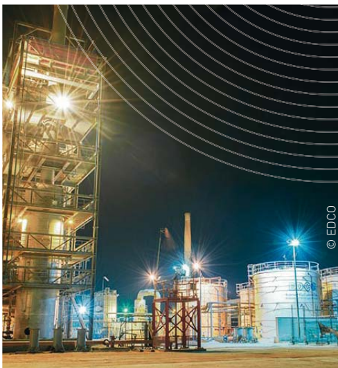
La Société Saoudienne EDCO

En Europe, le Groupe conforte sa position dans la valorisation des déchets au Royaume-Uni avec le Grand Manchester (contrat d'un montant de plus d'un milliard de livres sterling pour la gestion des déchets d'environ 2,3 millions d'habitants) et avec le Comté du Somerset (contrat d'un montant d'environ 243 millions d'euros pour le recyclage des déchets ménagers). En France, ont été renouvelés avec succès le contrat de gestion du service public de l'eau potable et de l'assainissement du Grand Chalon pour un chiffre d'affaires cumulé de 115 millions d'euros, ainsi que le contrat d'exploitation de l'unité de traitement et de valorisation énergétique des déchets de Rillieux-La-Pape , près de Lyon, pour un montant global de près de 79 millions d'euros.