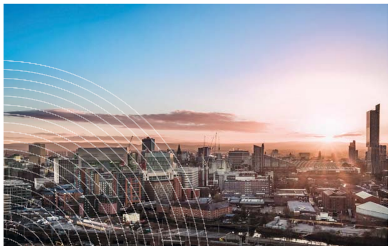
La ville de Manchester - Royaume Uni

A l'international, SUEZ remporte le contrat de traitement des eaux usées du parc industriel chimique de Dongying, en Chine , pour un montant total d'environ un milliard d'euros. Le Groupe se voit également confier la construction et l'exploitation de la plus grande station d'épuration en Inde, à New Delhi , pour un montant de 145 millions d'euros. SUEZ renforce également sa présence à Montréal en remportant un nouveau contrat de traitement des déchets organiques, pour un montant d'environ 115 millions d'euros. Enfin, SUEZ a pris une participation majoritaire dans la société saoudienne EDCO , spécialiste de la gestion des déchets dangereux.