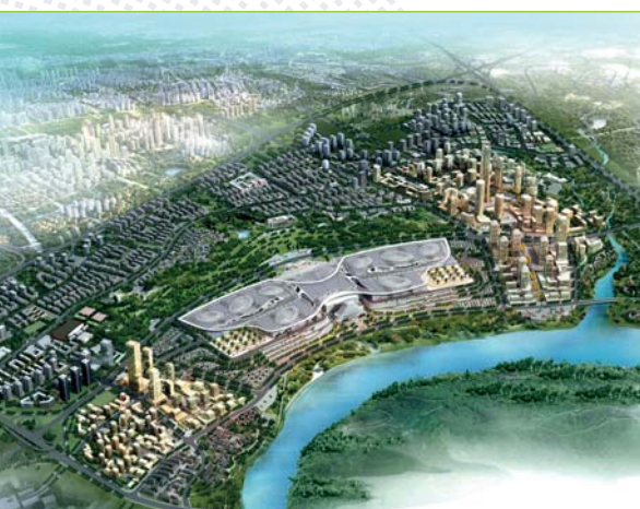
Future usine de traitement des eaux usées de Chengdong à Changshu