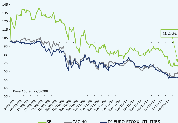
Cours de bourse de SUEZ ENVIRONNEMENT (données arrêtées au 17/03/09)