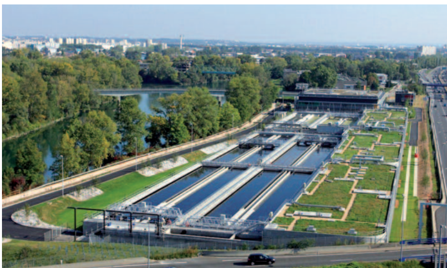
Station d'épuration des eaux de la Feysine (69)

Ces deux rencontres ont permis de présenter les résultats et les métiers de SUEZ ENVIRONNEMENT à près de 500 investisseurs particuliers.