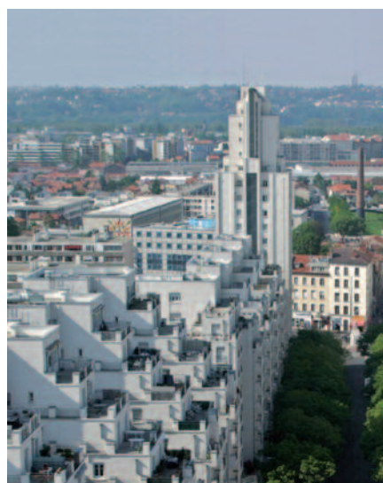
La Communauté urbaine du Grand Lyon