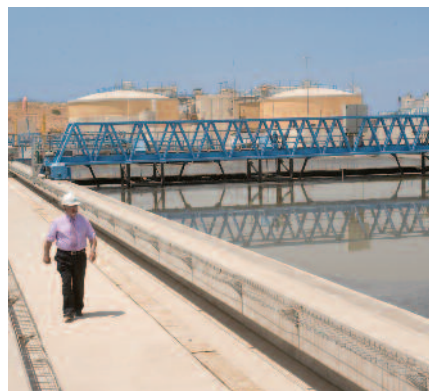
Usine de traitement des eaux usées de As Samra à Amman - Jordanie.

Ce contrat représente un chiffre d'affaires total de 150 millions d'euros et permettra de répondre aux besoins d'une population estimée de 3,5 millions d'habitants, soit près de 35% de la population du pays. Elle produira une eau traitée qui représentera près de 10% des ressources en eau de la Jordanie ; l'eau ainsi obtenue sera entièrement réutilisée dans l'irrigation. Le recyclage des eaux usées est un élément essentiel de la stratégie des autorités jordaniennes, confrontées à la croissance démographique de l'agglomération d'Amman et à la nécessaire protection des ressources hydriques du pays.