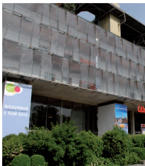
Réunion d'actionnaires à Lille Grand Palais 5 juin 2012

Premier musée nomade au monde, son accès gratuit permet de faire découvrir à tous les publics et tous ceux qui n'ont jamais visité de musée des chefs-d'œuvre de l'art moderne dans un programme d'étapes de trois ans. Avec ce partenariat, SUEZ ENVIRONNEMENT apporte son soutien à une initiative culturelle, fédératrice, humaniste et en partenariat avec les collectivités locales.