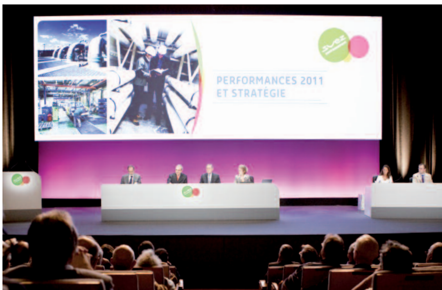
L'Assemblée Générale de SUEZ ENVIRONNEMENT du 24 mai 2012 à Paris - La Défense

Cette Assemblée Générale a été l'occasion pour le Président du Conseil d'administration et le Directeur Général de rendre compte aux actionnaires des résultats financiers, de revenir sur les événements et actions menées en 2011 et de présenter les perspectives et les principaux enjeux stratégiques.